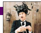
Nicolas Bellanger

d'Images. Intervenant : Nicolas Bellanger, réalisateur