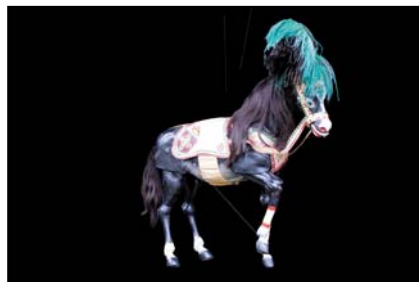
> Bijou théâtre Cheval - 1890, 60 cm - © collection C. & D. Bertault Exposition "Au fil des Marionnettes" - Maison de la Magie - Blois > MAGIE-BLOIS-2012-12.jpg