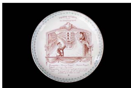
> Assiette - fin XIXe siècle © collection C. & D. Bertault Exposition "Au fil des Marionnettes" - Maison de la Magie - Blois > MAGIE-BLOIS-2012-19.jpg