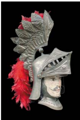
> Paladin de Catane - fin XIXe début XXe siècle 45 cm avec corps 1m20 Exposition "Au fil des Marionnettes" Maison de la Magie - Blois > MAGIE-BLOIS-2012-05.jpg