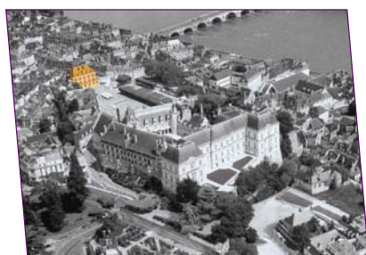
Place du Château