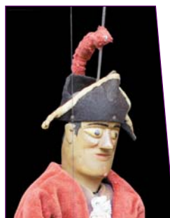
La fleur à tringle - 1940 - H 41 cm