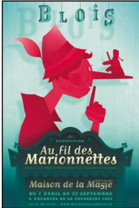
> Affiche de l'exposition - 40x60 cm © Dr. Pêche / Laboratoires CCCP pour la Maison de la Magie - BLOIS Exposition "Au fil des Marionnettes" Maison de la Magie - Blois > MAGIE-BLOIS-2012-21.jpg

Les mentions des crédit photos et légendes complètes sont obligatoires - d'avance merci