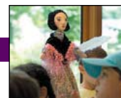
Cie du Petit Bois