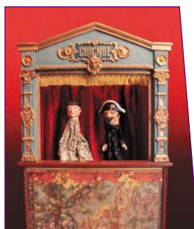
Castelet guignol, gendarme et bougnat 1900 - H 110 cm © collection C. & D. Bertault