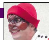
Krizo Théâtre

Déambulation de 16h à 18h, départ Fontaine place Louis XII