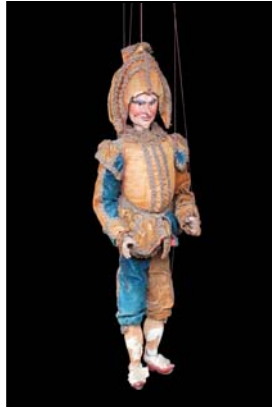
> Polichinelle à tringle italien fin du XVIIIe siècle, 55 cm Exposition "Au fil des Marionnettes" Maison de la Magie - Blois > MAGIE-BLOIS-2012-02.jpg