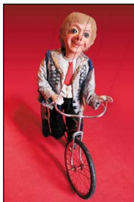
> Marionnette acrobate du Bijou théâtre 1890, 70 cm Exposition "Au fil des Marionnettes" Maison de la Magie - Blois > MAGIE-BLOIS-2012-13.jpg