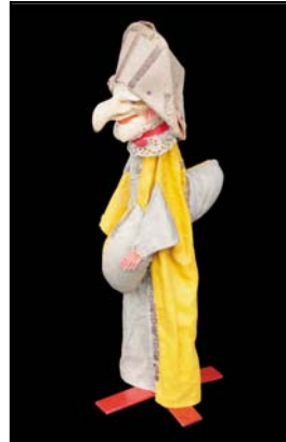
> Polichinelle - vers 1920, 38 cm Exposition "Au fil des Marionnettes" Maison de la Magie - Blois > MAGIE-BLOIS-2012-03.jpg