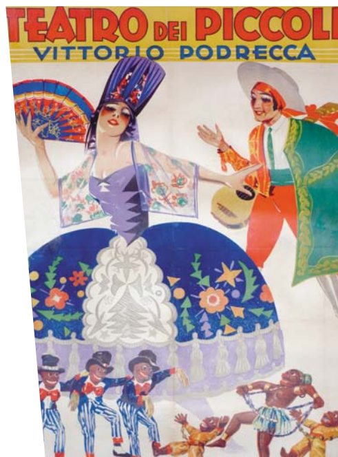
Affiche du Théâtre de Piccoli - H 90 x L 70 cm

Plus récemment, l'excellent film Dans la peau de John Malkovitch (Spike Jonze, 1999) propose une réflexion passionnante sur la symbolique des marionnettes, notamment autour de la manipulation psychologique de l'artiste devenu lui-même un pantin.