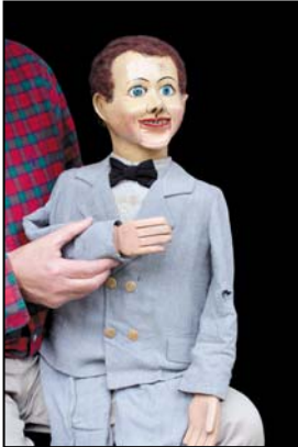
> Marionnette ventriloque entre 1940 et 1950, 88 cm Exposition "Au fil des Marionnettes" Maison de la Magie - Blois > MAGIE-BLOIS-2012-18.jpg

Les mentions des crédit photos et légendes complètes sont obligatoires - d'avance merci