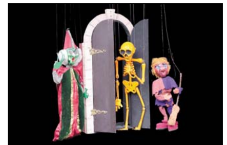
> Sorcier et compagnie, troupe des Ener's - 1950, 60cm Exposition "Au fil des Marionnettes" - Maison de la Magie - Blois > MAGIE-BLOIS-2012-15.jpg