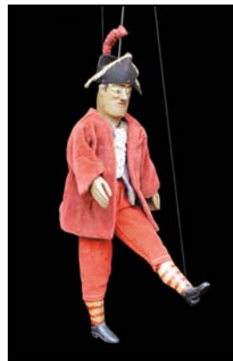
> Lafleur à tringle - 1940, 41 cm © collection C. & D. Bertault Exposition "Au fil des Marionnettes" Maison de la Magie - Blois > MAGIE-BLOIS-2012-07.jpg