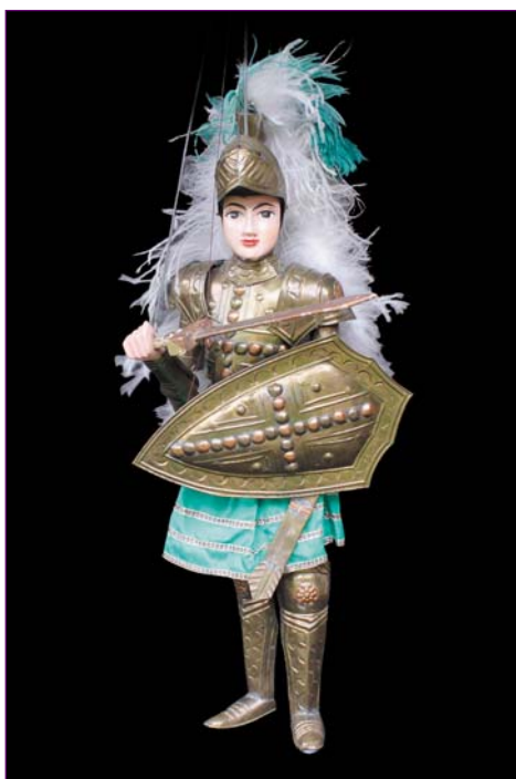
Paladin de Palerme, marionnette à tringle sicilienne - années 50 - 66 cm

L'histoire est prise beaucoup moins au sérieux, avec les marionnettes liégeoises. Tchanchès, héros local, mêle son grain de sel à l'épopée, et au besoin, règle le conflit à sa manière.