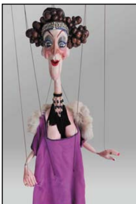
> Marionnette cantatrice Music-hall 1970, 80 cm © collection C. & D. Bertault Exposition "Au fil des Marionnettes" Maison de la Magie - Blois > MAGIE-BLOIS-2012-11.jpg