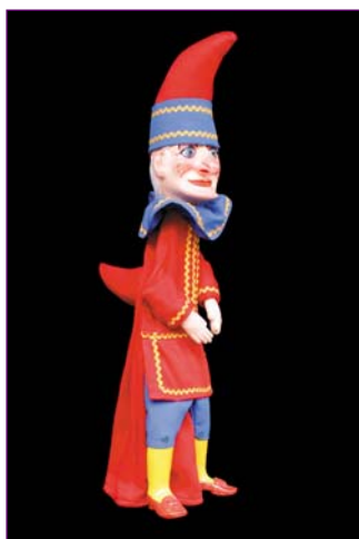
Punch, marionnette à gaine anglaise années 80 - 58 cm

Kasperek manifeste toujours une grande joie de vivre et se laisse parfois emporté par sa vivacité, néanmoins tempérée par sa sagesse et son bon sens. Sans peur et sans reproche, il ne se lasse pas de combattre pour la liberté et la justice. Son faire-valoir se nomme Skribolf. La qualité du cinéma d'animation de marionnettes tchèque est mondialement connue, grâce à des pionniers comme le créateur Jiri Trnka ( Songe d'une nuit d'été , Prince Bayaya ).