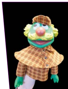
Muppet Sherlock

On prend de la hauteur avec LA MARIONNETTE A TRINGLE , suspendue et manipulée par une forte tige de fer fichée au sommet de la tête. Technique traditionnelle des marionnettes picardes (Lafleur), belges (Le Barbizier à Liège, le théâtre Toone de Bruxelles) et siciliennes, elles sont articulées et mues essentiellement par effet d'inertie dû à leur poids.