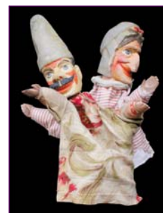
Punch et Judy marionnettes à gaine anglaise vers 1920, 25 à 30 cm

LA MARIONNETTE A FILS se développe en Angleterre, au début du XIX e siècle. L'accrochage des fils au contrôle ou attelle, obéissait à une technique autrefois secrète, d'où le terme ensecrètement. Aristocrates de la marionnette, les poupées à fils furent très utilisées pour les spectacles d'opéra, de variétés et de music-hall très proches du théâtre d'acteur.