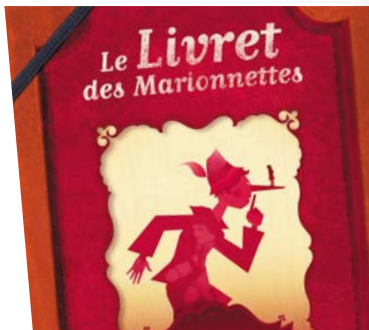
couverture du Livret des Marionnettes