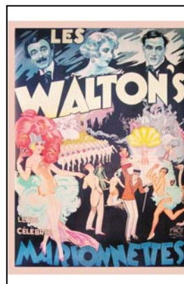
> Affiche des Walton's - 1925, 120x160cm Exposition "Au fil des Marionnettes" Maison de la Magie - Blois > MAGIE-BLOIS-2012-14.jpg