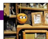
La Note muette

Rejetée par ses pairs en raison de sa différence, une note de musique muette part en quête de rencontres pour tenter d'échapper à son handicap.