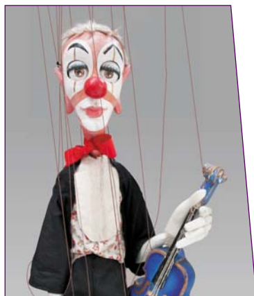
Clown au violon bleu - H 75 cm