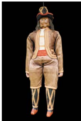
> Marionnette Toone VI de Bruxelles 1920, 90 cm © collection C. & D. Bertault Exposition "Au fil des Marionnettes" Maison de la Magie - Blois > MAGIE-BLOIS-2012-06.jpg