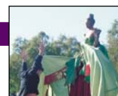
Pinocchietta - © DR

Premier et unique parc d'attractions destiné aux marionnettes