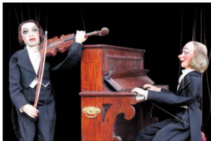
> Musiciens à fils, Pajot-Walton's - début XXe siècle, 70 cm Exposition "Au fil des Marionnettes" - Maison de la Magie - Blois > MAGIE-BLOIS-2012-10.jpg