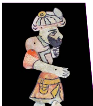
Karagöz turc - 1950 - 34 cm