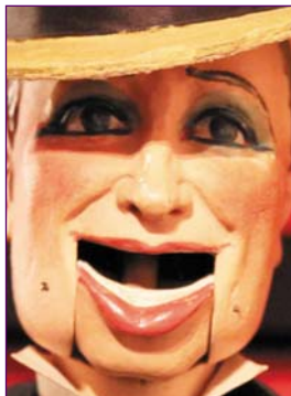
Maurice Chevalier marionnette du théâtre des Pajot Walton's 1930, 70 cm