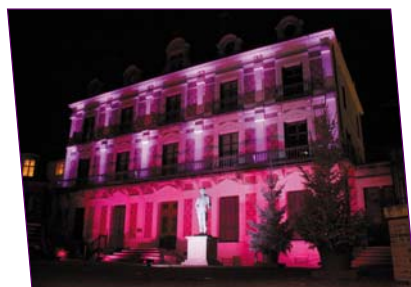
Maison de la Magie en nocturne - © Dr. Pêche

Située face au Château Royal de Blois, la Maison de la Magie Robert-Houdin est ouverte du 7 avril au 23 septembre et du 27 octobre au 7 novembre 2012 (vacances de la Toussaint).