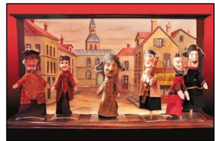
> Personnages du Guignol - fin XIXe siècle, 45 cm Exposition "Au fil des Marionnettes" - Maison de la Magie - Blois > MAGIE-BLOIS-2012-09.jpg