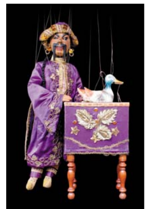
> Magicien chinois à fils du théâtre forain des Lilliputiens - vers 1920, 74 cm Exposition "Au fil des Marionnettes" Maison de la Magie - Blois > MAGIE-BLOIS-2012-16.jpg