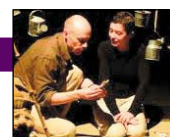
Cie Allo Maman Bobo