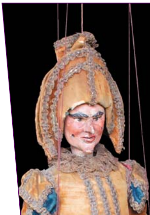
Polichinelle à tringle italien fin du XVIII e siècle - H 55 cm