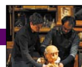
Cie du petit Monde