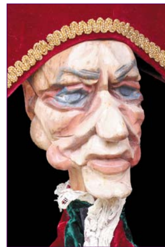
Polichinelle - années 30 - H 50 cm