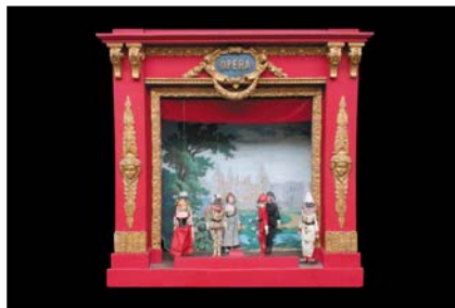
> Théâtre opéra, marionnettes à tringle de la commedia dell'arte 1890, 60 x 70 cm Exposition "Au fil des Marionnettes" - Maison de la Magie - Blois > MAGIE-BLOIS-2012-01.jpg