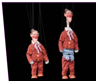
Laurel, marionnette à transformation vers 1950, 55 cm