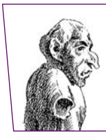
Maccus (extrait de l'Histoire du théâtre italien de Riccoboni)

En français, le mot marionnette prend sa signification actuelle au Moyen Age. Dérivé de Marie, il devient "Petite Marie", une poupée qui figurait la Vierge Marie pour jouer des épisodes bibliques dans les églises. La version anglo saxonne ne retient pas cette connotation religieuse mais la traduction du mot poupée (puppet en anglais, puppe en allemand). Durant le haut Moyen Age, les marionnettes restent silencieuses.