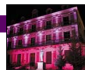
Maison de la Magie

Déambulation d'un automate vivant, visite animée de l'exposition, démonstrations de marionnettes automates et tours de magie.