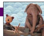
7, 8, 9 Boniface

Film d'animation de Pierre-Luc Granjon, Antoine Lancieux et Verena Fels