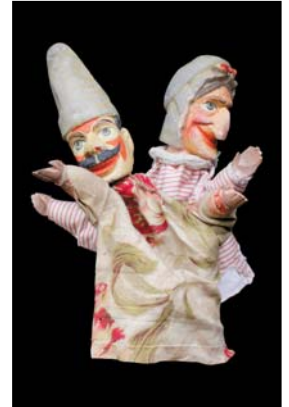
> Punch et Judy, marionnettes à gaine anglaise vers 1920, 25 à 30 cm Exposition "Au fil des Marionnettes" Maison de la Magie - Blois > MAGIE-BLOIS-2012-04.jpg