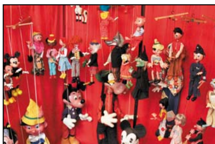
> Grand ensemble Pelham puppets entre 1950 et 1970, de 30 à 90 cm Exposition "Au fil des Marionnettes" - Maison de la Magie - Blois > MAGIE-BLOIS-2012-17.jpg