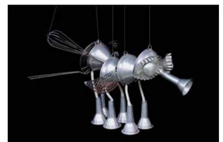
> Marionnette objet contemporaine - 35 cm Exposition "Au fil des Marionnettes" - Maison de la Magie - Blois > MAGIE-BLOIS-2012-20.jpg