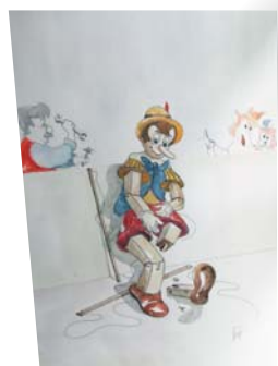
lithographie en édition limitée - 40x60 cm Marc Noiroth © Maison de la Magie

Écrit spécialement pour cette exposition par le metteur en scène Yves Javault (auteur d'une trentaine de pièces de théâtre), un savoureux dialogue filmé entre le ventriloque Christian Gabriel et 3 marionnettes, clôture avec fantaisie le parcours principal de la visite. Un amusant clin d'œil au lien prolifique qui unit les marionnettes à l'image !