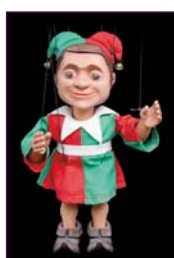
Kasperek tchèque à fils - années 2000 - 40 cm