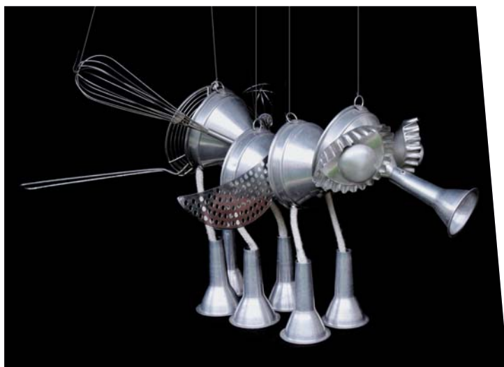
Marionnette objet contemporaine - 35 cm

En France, les exemples de compagnies sont nombreux : le théâtre Manarf, le Vélo Théâtre ou le travail d'Yves Joly dans Ombrelles et parapluies où des parapluies divers sont les protagonistes d'une histoire d'amour ayant pour cadre Paris.