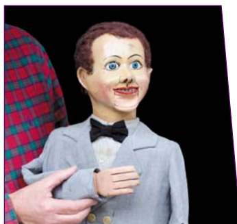
Marionnette ventriloque - entre 1940 et 1950, 88 cm